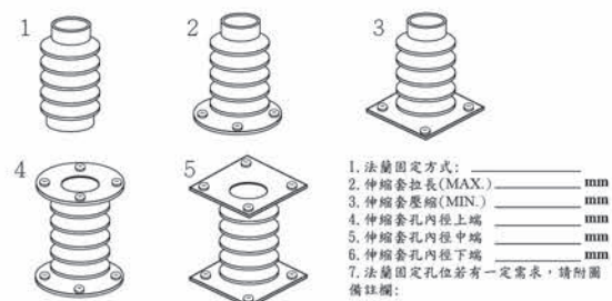
圓型伸縮護套法蘭裝置方式